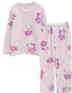
長袖トップス&ロングパンツセット (カラー：ピンク)