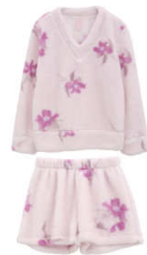
長袖トップス&ショートパンツセット (カラー：ピンク)