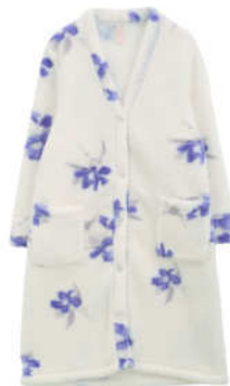
ロングカーディガン (カラー：アイボリー)