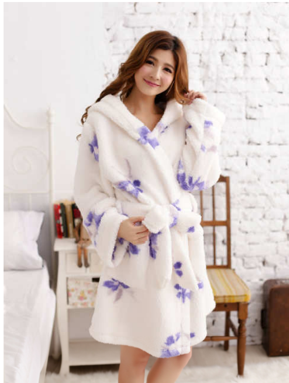
フード付きガウン バスローブ B4715W150 （カラー：アイボリー）

下着通販サイト「京都発インナーショップ白鳩」を運営する株式会社白鳩（本社：京都府京都市、代表取締役社長：池上勝）は、ルームウェアのオリジナルブランド「blooming FLORA（ブローミング フローラ）」から『2015 秋冬コレクション クレマチスフローラル』を10月9日（金）より発売しました。