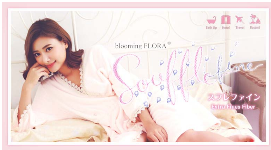
バスローブ B7016T802 (カラー：ピーチ)

下着通販サイト「京都発インナーショップ白鳩」を運営する株式会社白鳩（本社：京都府京都市、代表取締役社長：池上勝）は、ルームウェアのオリジナルブランド「blooming FLORA (ブローミング フローラ)」より、2016年9月23日（金）に販売開始した、お風呂上りに最適な『Souffle Fine (スフレファイン)』シリーズの売上が好調に推移、1か月間の販売実績は、前年シリーズ比約135%を達成しました。